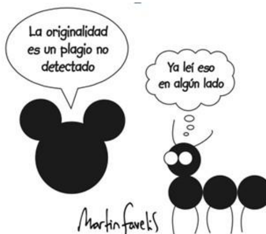
Figura 1. Caricatura sobre plagio. Este apartado sirve para explicar la figura y darle un título, debe colocarse dentro del diseño. Adaptada de Favelis, s.f.

*NOTA IMPORTANTE: Ninguna figura, ni tabla debe ir enmarcada.